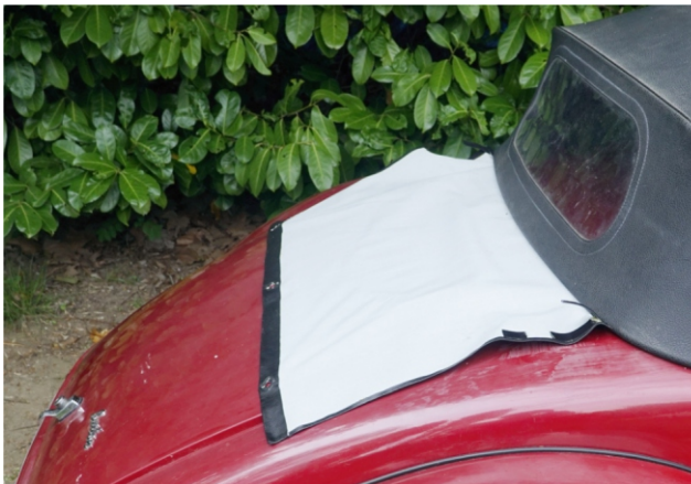
Le couvre capote déroulé; on perçoit les velcros qui servent à le maintenir roulé. Pour résister à l'arrachement le velcro passe à travers des fentes du skaï et est collé sur son envers avec de la colle néoprène.