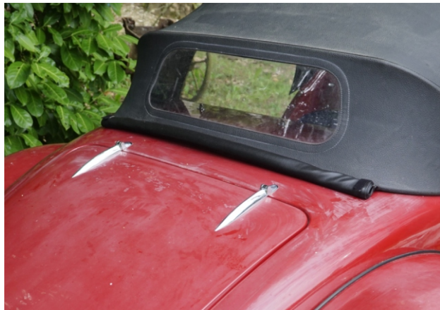
Capote en place et couvre capote roulé à l'arrière.