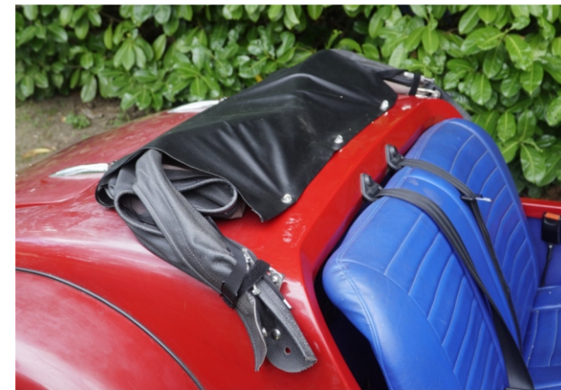
Blocage de la capote. Je n'ai pas prolongé les parties latérales du couvre-capote et je me contente de petites sangles pour maintenir la capote sur les côtés.